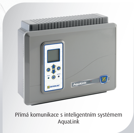
Přímá komunikace s inteligentním systémem Aqualink